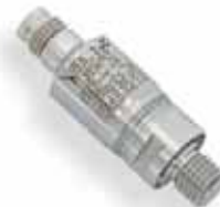
Serie 21 PY „Pisello“ Extra klein. Diameter 13 mm. Middel- en hoge drukopbouw voor absolute drukmetingen.