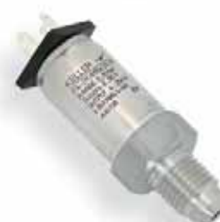
Serie 21 Y Breedte standaardgamma. Absolute en relatieve drukmetingen in een bereik van 2...1000 bar.