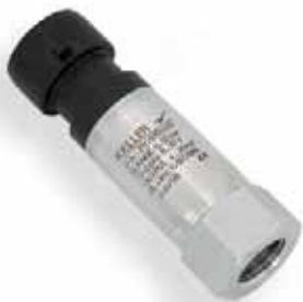
Serie 21 Y ...met binnenschroefdraad