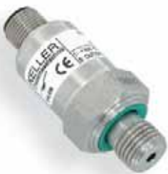
Serie 23 (S)Y / 25 Y Hoge performance en diverse varianten. Diverse druk- en elektrische aansluitingen. Drukbereik van 0,2...1000 bar.